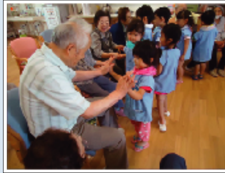
園児さんとの交流もいつも利用者さまの楽しみになっています。