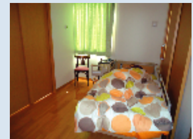
お泊まりのベッドです。