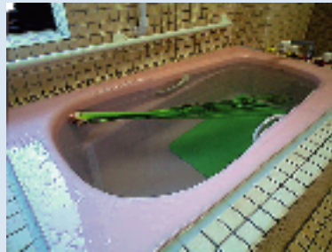
これは菖蒲湯 お一人おひとり、ゆったりと入浴して頂いております。