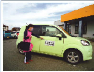
訪問に向う 四季のベンチのスタッフです。