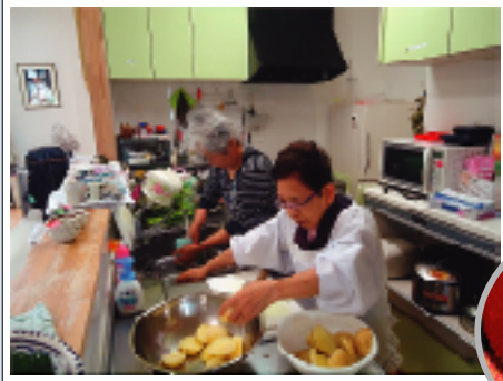
地元の食材で手作りの食事を提供しています。