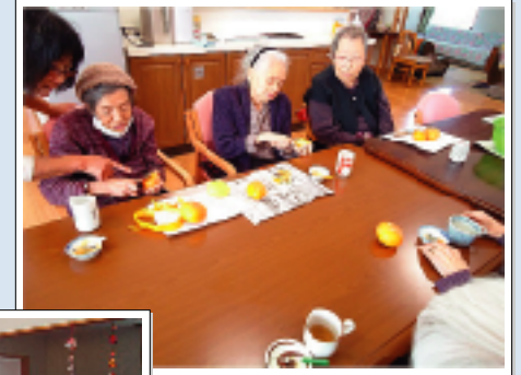
干し柿作りをしました。 季節にあった活動を日々しています。