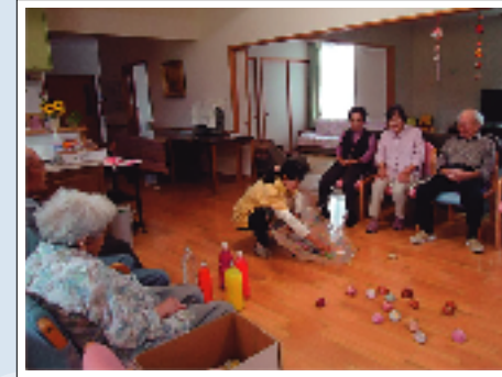
日常生活動作を活かした レクリエーションを 毎日取り入れています。